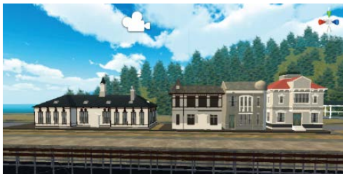
ムゼウム復元4棟イメージ案 (敦賀港レトロ浪漫ARアプリより)

2018年度の予算は9,210万6千円(内3,289万円が国の負担)ではありますが、来年度以降、大きな予算が見込まれています。確かに2022年度末の北陸新幹線・金沢～敦賀間の開業を見据えたまちづくりも大切であります。しかし、観光事業に大きな予算が配分されることで、ご高齢の方や障がいのある方のための福祉予算や、子どもたちのための教育予算等が圧迫されることも危惧されています。実際に敦賀市へ来られる観光客の8割を占める関西・中京方面の方々は、「敦賀市にはハコモノが多い」と感じておられ、敦賀市へ来られる理由は、「豊かな自然や美味しい食を求めて」とのアンケート結果も出ているなか、新たなハコモノ建設には疑問が残ります。